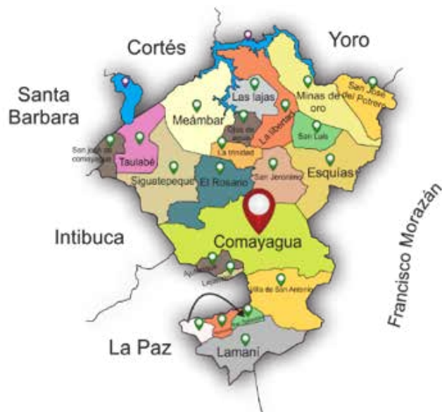
Figura # 1. Mapa político del Depto. Comayagua