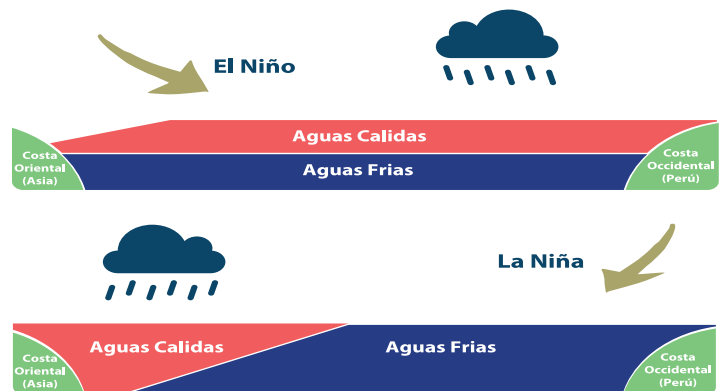
Figura: Oscilación del Sur.

Tomando de referencia los análisis realizados por instituciones internacionales como la NOAA, Oficina Meteorológica de Australia y lo expresado por el Centro de Estudios Atmosféricos Oceanográficos y Sísmicos (COPECO-CENAOS), indican que actualmente se encuentra una condición temporal neutral con la probabilidad que evolucione a niño durante al segundo semestre del año.