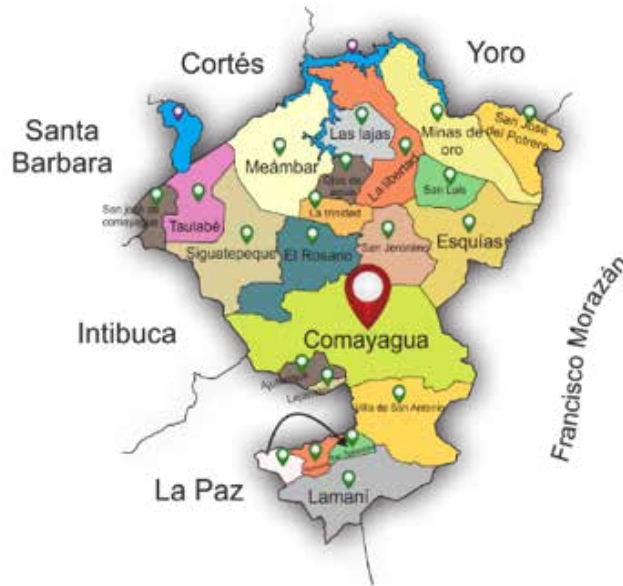
Figura # 1. Mapa político del Depto. Comayagua